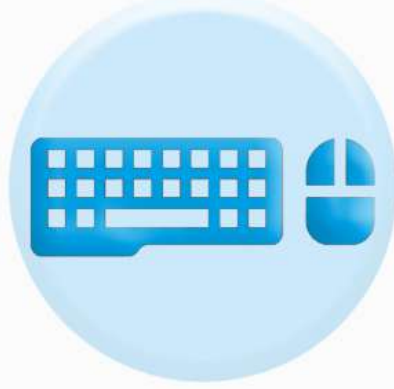
КЛАВИАТУРА ОРГТЕХНИКИ И МЫШКА