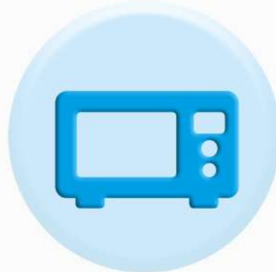
ПАНЕЛИ БЫТОВОЙ ТЕХНИКИ