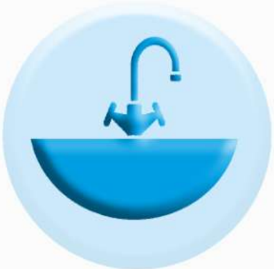
РАКОВИНЫ И СМЕСИТЕЛИ