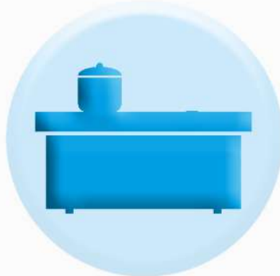
ПОВЕРХНОСТИ СТОЛЕШНИЦ, ПОЛОК