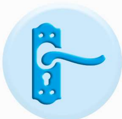
РУЧКИ ДВЕРЕЙ И ШКАФОВ

ТО, К ЧЕМУ МЫ ПРИКАСАЕМСЯ ЧАЩЕ ВСЕГО ДОЛЖНО БЫТЬ ЧИСТЫМ