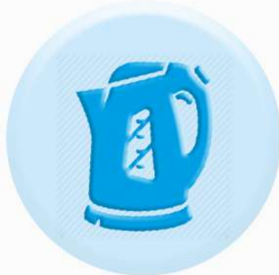
КНОПКИ БЫТОВЫХ ПРИБОРОВ