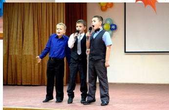
Фоторепортаж Борисова Софи 2»з» класс